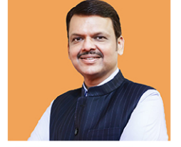
देवेन्द्र फडणवीस मुख्यमंत्री महाराष्ट्र