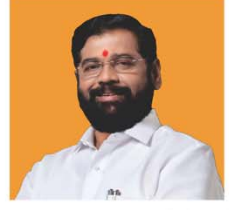
एकनाथ संभाजी शिंदे उप मुख्यमंत्री महाराष्ट्र